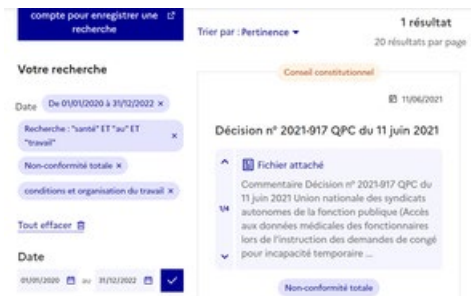
résultat de recherche avancée avec des critères